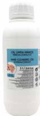
ENVASE DE 1 L