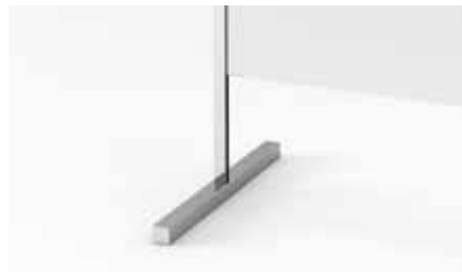
DETALLE PIE ANTIDESLIZANTE