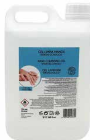
ENVASE DE 5 L