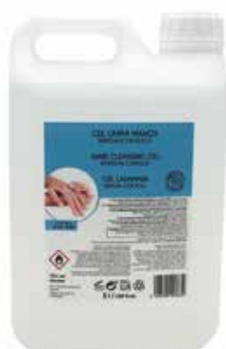
ENVASE 5 L GEL DESINFECTANTE